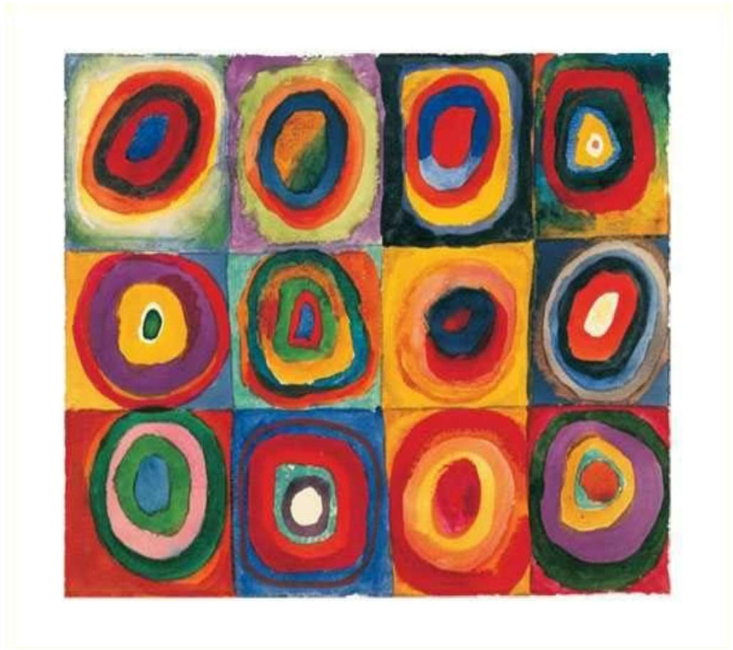
لوحة للفنان كاندانسكي (bauhaus)