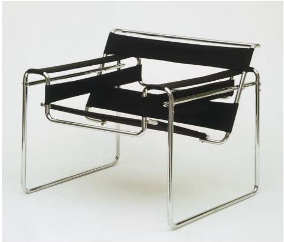
فن الديزاين (design) كرسي

ملاحظة الفراغ الواسع نسبياً في تصاميم الباهاوز و استخدام نمط معين في طباعة الحروف. إضافة إلى ادخال التصوير الفوتوغرافي و مونتاج الصور إلى الفن الجميل. يرى العديد من الناقدين أن الباهاوز لم تكن ذات طراز معين بحد ذاتها بقدر ما أنها كانت وسيلة فتحت ابداعاً غير محدد بطراز أو ضوابط معينة.