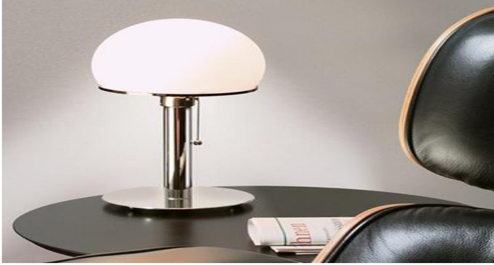
فن الديزاين (design) عاكس النور

التبسيط والتجربة و العودة للشكل الأساسي كان من الأساسيات التي تلاحظ في أعمال الباهاوز كما تعتمد على استخدام الألوان الأساسية حيث يتركز استخدام الألوان على الأحمر و الأزرق و الأصفر. كما يلاحظ في طراز الباهاوز التركيز على الأشكال الهندسية الأساسية: (الدائرة و المربع و المثلث) استخدام الخطوط و الابتعاد عن المركزية في وضعية الصورة. كذلك