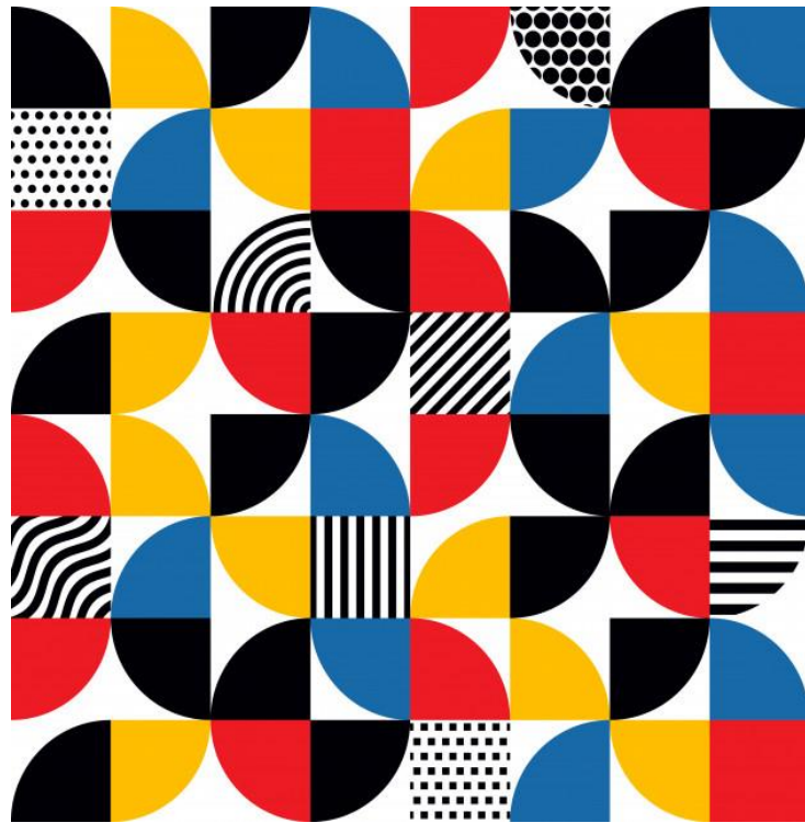
زخرفة تمثل تيار الباهوس